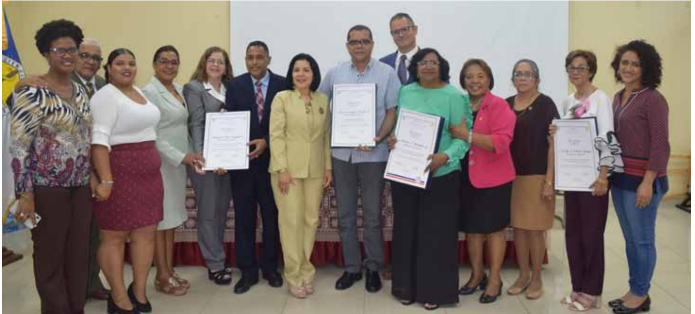
Autoridades y miembros del Consejo Directivo FCS junto a los homenajeados.