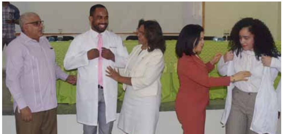
Autoridades colocan batas blancas a dos de los preinternos que asistieron a la ceremonia.