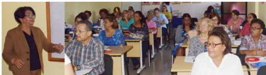
Facilitadora y docentes de la Escuela de Bioanálisis que participaron en el taller.

Bioanálisis, también ofreció a sus docentes un taller de actualización pedagógica, al que asistieron 61 maestros de esa unidad académica.