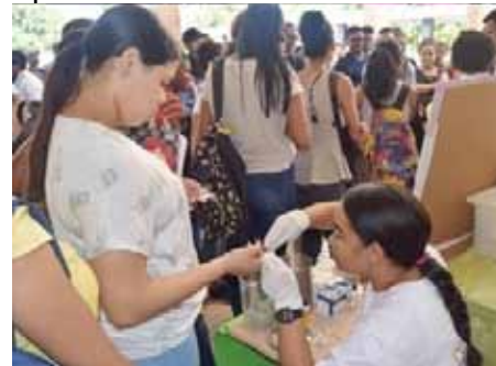
Estudiantes de medicina realizan la prueba de tipificación sanguínea.

dades contenidas en el programa de la actividad, entre las que destacó la realización de pruebas de tipificación.