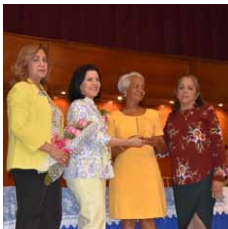
Autoridades entregan placa de reconocimiento a docente de la Escuela.

El Aula Magna de la Universidad Autónoma de Santo Domingo sirvió de escenario a la Jornada Científica titula-