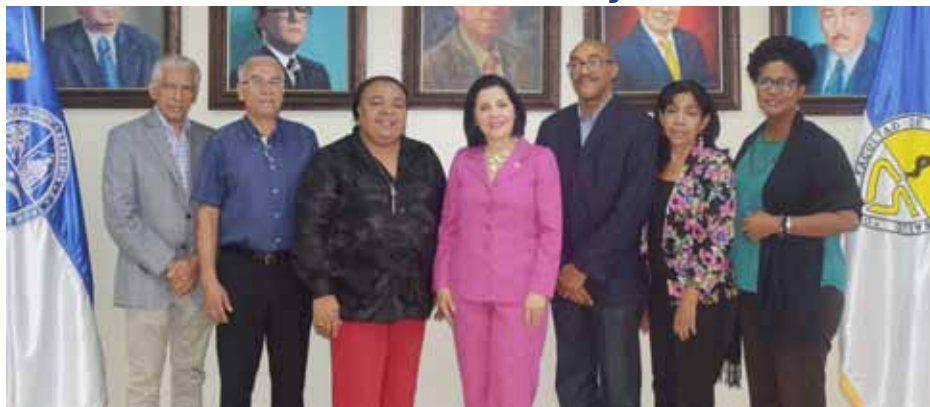
Autoridades junto a docentes que conforman el Consejo de PhD de la FCS.