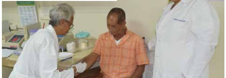
Momentos en que a uno de los empleados de mayordomía se le toma una muestra de sangre para realizarle una prueba.

gastable, así como a los docentes y estudiantes que participaron como voluntarios en la actividad.