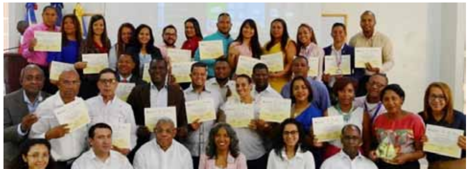
Autoridades y docentes junto al personal de salud que realizó el diplomado.