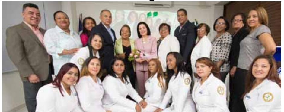
Autoridades y docentes junto a las nuevas internas de la carrera de Enfermería.