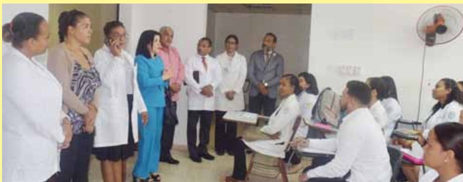
Autoridades de la Facultad de Ciencias de la Salud junto a directivos del hospital.

En tanto que, las autoridades del centro ofrecieron un recorrido a las autoridades universitarias por sus distintos espacios, y resaltaron el esfuerzo que vienen realizando para lograr la transformación y apertura de importantes áreas.