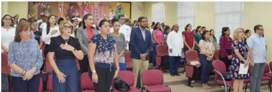
Público compuesto por docentes, profesionales y estudiantes que dieron su respaldo a la actividad.

A la actividad, celebrada en el auditorio Agustín Heredia, asistieron autoridades universitarias, docentes, estudiantes e invitados especiales.