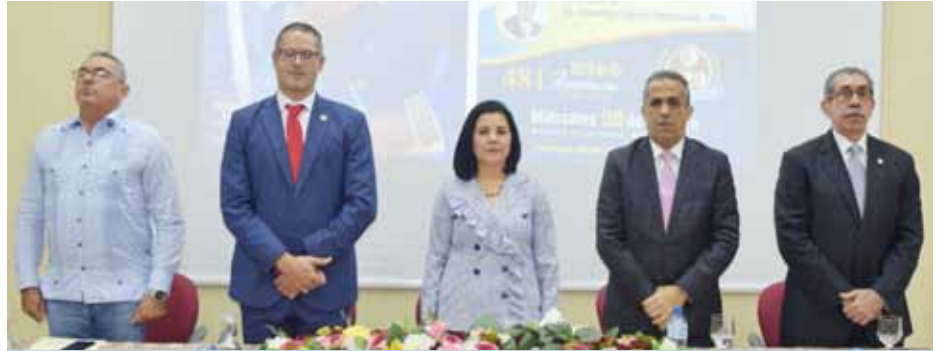
Autoridades y docentes que presidieron la mesa de honor en la apertura de las jornadas.

La 3ra. Jornada Científica Odontológica Interuniversitaria contó con la participación de la Universidad Iberoamericana (UNIBE), Universidad Eugenio María de Hostos (UNIREMHOS) y la Universidad Central del Este (UCE), y en la misma se dio la oportunidad a estudiantes de dichos centros educativos a presentar sus trabajos finales de grado.