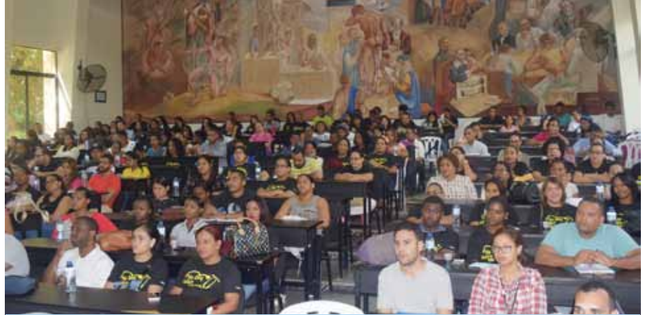
Estudiantes de Medicina presentes en la actividad formativa.

A la actividad, que se llevó a cabo en el auditorio Guarocuya Batista del Villar, de la Escuela de Medicina, asistieron decenas de estudiantes.