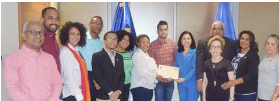
Miembros del Consejo Directivo FCS junto al enfermero reconocido.

El joven enfermero agradeció a las autoridades por la distinción recibida y a quienes fueron sus docentes por contribuir con su formación académica, y manifestó su interés de realizar posteriormente una maestría en el área de salud mental.