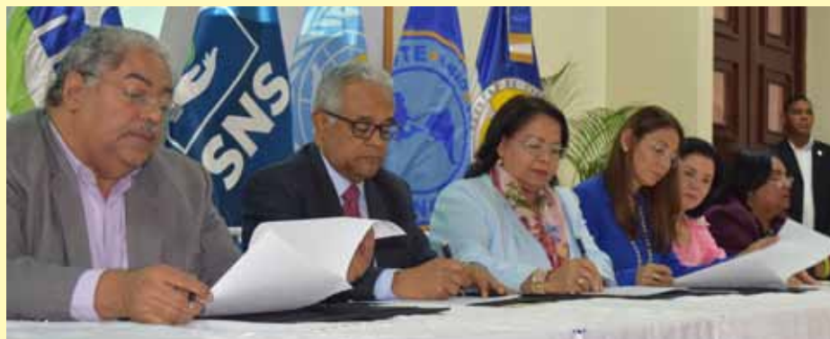
Autoridades firman la carta de intención en representación de sus respectivas instituciones.

De su lado, el Ministro de Salud y el representante de la OPS también valoraron la coordinación entre las distintas entidades participantes en la iniciativa, y resaltaron el compromiso y responsabilidad de los distintos actores del sector salud en la prevención de las enfermedades cardiovasculares.