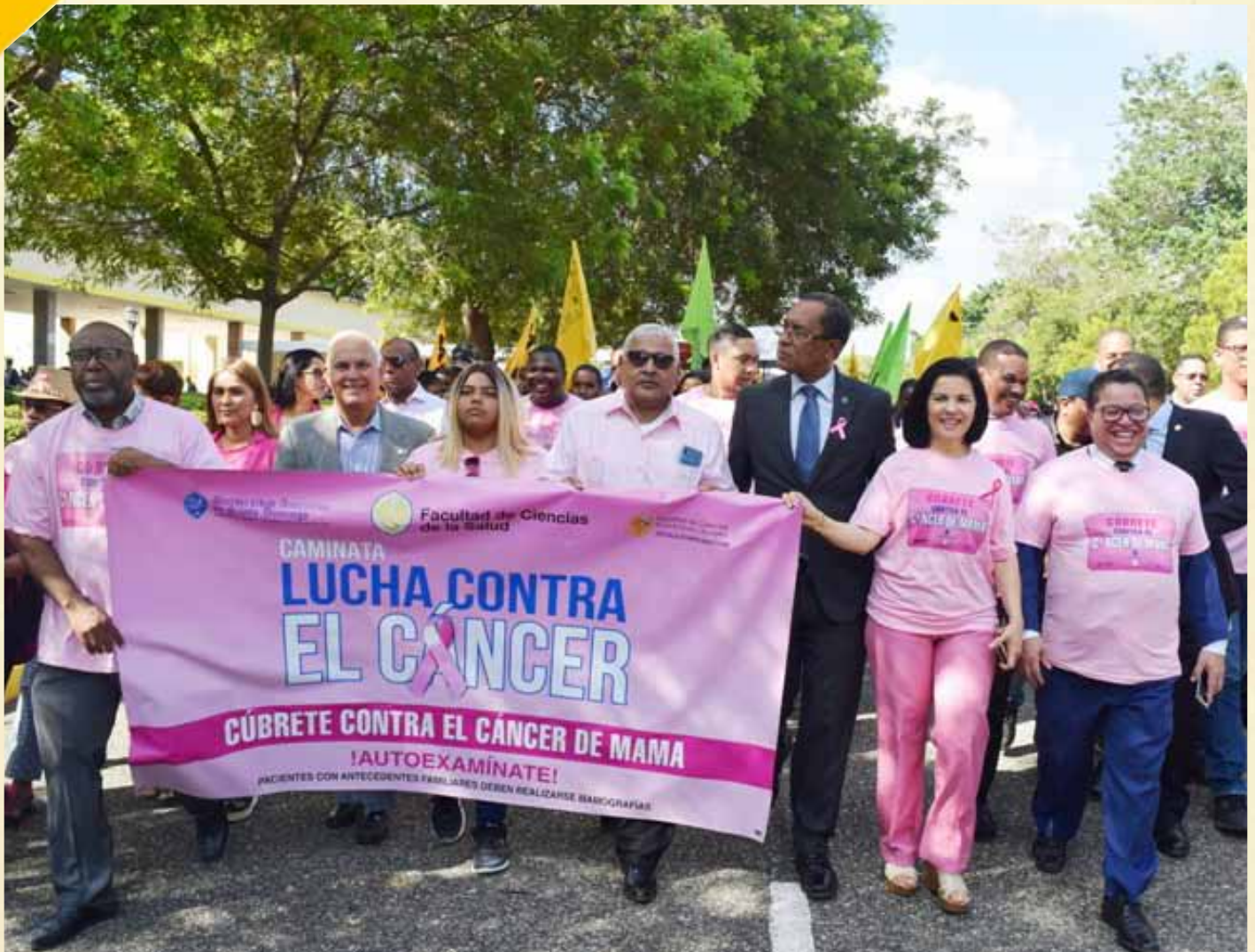
Autoridades encabezan la caminata en el campus universitario.