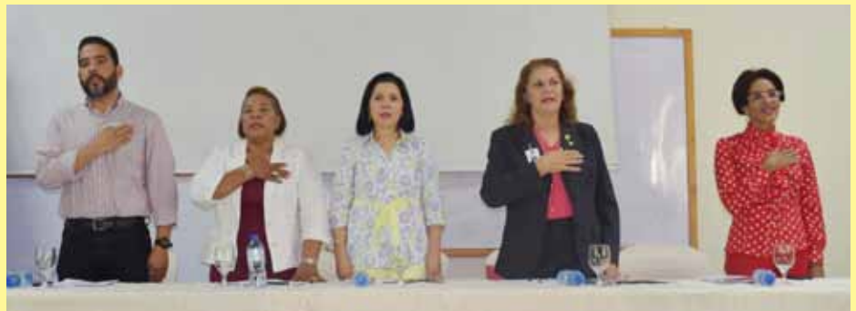
Integrantes de la mesa principal en el acto de apertura del congreso.

El acto inaugural de la actividad fue presidido por la doc-