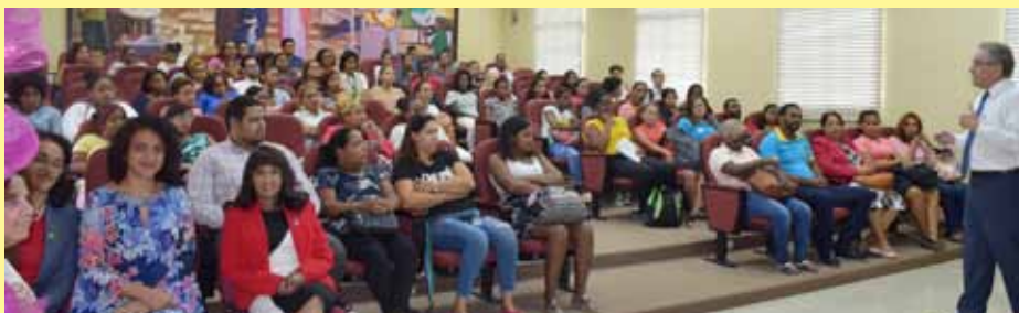
El conferencista en su exposición sobre el rol del farmacéutico en la sociedad.